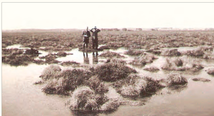
Fig. 5 Ved gåsehullerne omkring 1960.

for den eneste videnskabelige artikel fra KOP's hånd, nemlig "Storkekolonien i Veddum" i Dansk Ornitologisk Tidsskrift (Pedersen 1945). Det har sikkert også været i KOP's tanker at skrive en artikel til publicering om Sort Stork, i hvert fald fandtes der i hans efterladte papirer et fyldigt udfærdiget dokument, der kunne ligne skitsen til et manuskript, og som med en skønssom redigering af nærværende forfatter bringes i det efterfølgende.