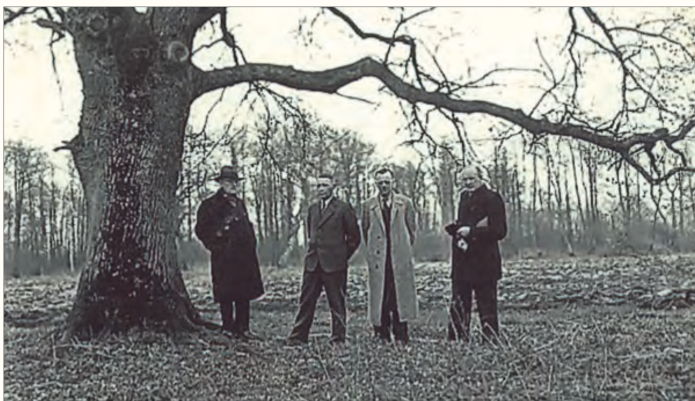
Fig. 2 Besøg i Tofte Skov i 1944. KOP nr. 10 fra venstre.

Dansk fugleforskning og interessen for ornitologi i det hele taget var indtil for et halvt hundrede år siden overvejende en beskæftigelse for folk bosat i Københavnsområdet, det gjaldt de få forskere tilknyttet universitetet og Zoologisk Museum, men også den lille eksklusive medlemskreds i Dansk Ornitologisk Forening. KOP blev medlem af foreningen i 1927. Det var dengang usædvanligt at finde en jysk gårdejer i dette selskab.