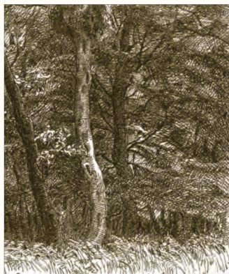
Fig. 6 Johannes Larsens tegning af den sorte storks rede i Tofte Skov 1932.

Det efterfølgende er en gennemgang af udvalgte arter på grundlag af KOP's efterladte notater, korrespondance og litteraturhenvisninger, hvor han er anført som kilden samt uddrag af hans dagbogsnotater (kursiv), men ellers indgår dagbogsoptegnelserne i den endelige artsliste side 381 i denne bog.