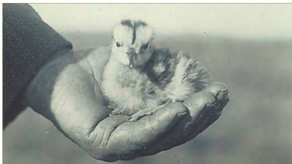
Fig. 3 Storspoveunge i KOP's hånd - Lille Vildmose. 23. maj 1937 (se også fig. 9 side 261).

En anden kilde til indsigt i egnens fugleliv i tiden er den store fuglesamling, som KOP